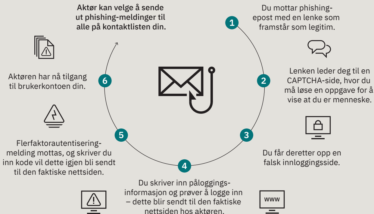
Figur 3: Hvordan ondscinnede aktører bruker angriper-i-midten-phishing for å lure til seg innloggingsdetaljer og å komme seg forbi flerfaktorautentisering.